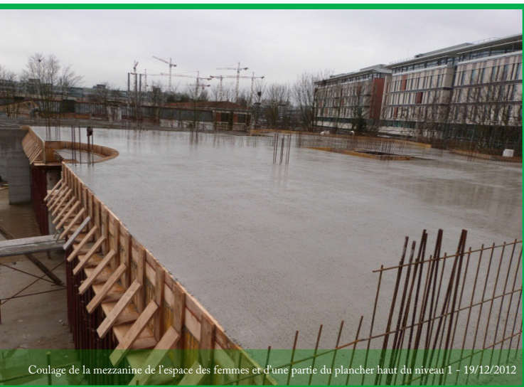
Coulage de la mezzanine de l'espace des femmes et d'une partie du plancher haut du niveau 1 - 19/12/2012