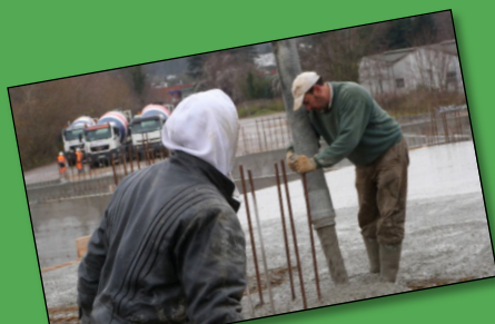
Le béton est pompé par une toupie et coulé sur le coffrage

La période hivernale laissera place au démarrage de la phase de second œuvre pour les espaces de prière :