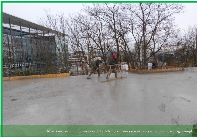
Mise à niveau et uniformisation de la dalle : 3 semaines seront nécessaires pour le séchage complet.